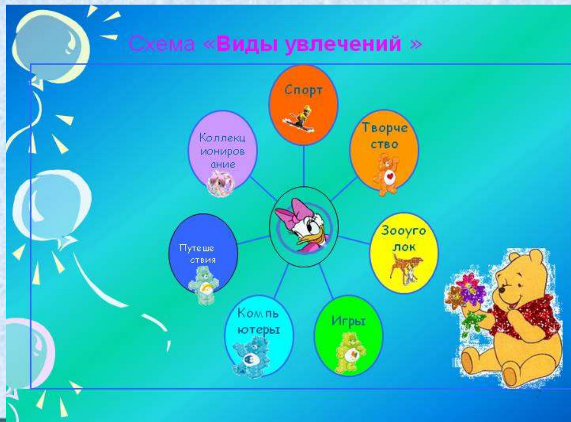
Схема «Виды увлечений»

Специфика интересов подростков заключается в том, что эти интересы во многом обслуживают потребность со сверстниками: общие увлечения дают повод для общения и необходимые средства. Подросток интересуется тем, что интересно этой компании.